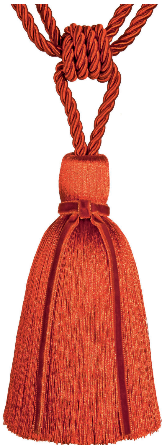
15639/A col. ORANGE