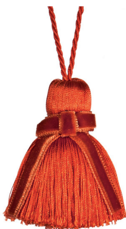
15640/A col. ORANGE